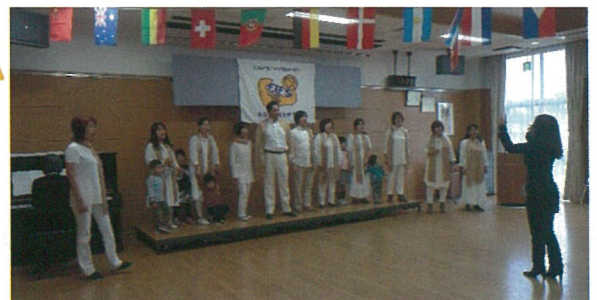
イタリア オペラ合唱団SOLEの皆さん